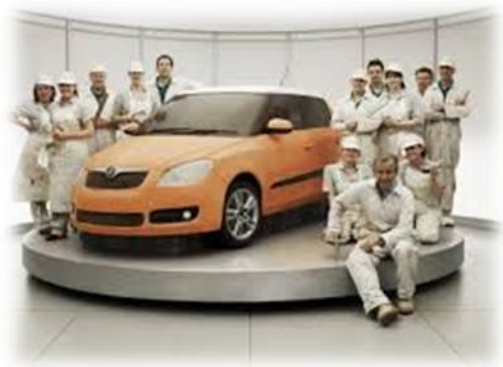
2.6.5. კადრი შკოლა ფაბიას ფირმის რეკლამირებული მანქანის რეკლამიდან.

„გემრიელის“ ეფექტი- ხშირად კომუნიკატორები აუდიტორიის ემოციურ დარწმუნებას დომინანტური გემოს ეფექტის შექმნითაც ცდილობენ. ბუნებრივია, ასეთი ტიპის რეკლამები უმეტესად საკვების, რესტორნებისა და სხვა სასააღილო პუნქტების პროდუქციას უკეთდება, თუმცა გამონაკლისებიც არსებობს. ვფიქრობთ, ამ მხრივ საინტერესოა