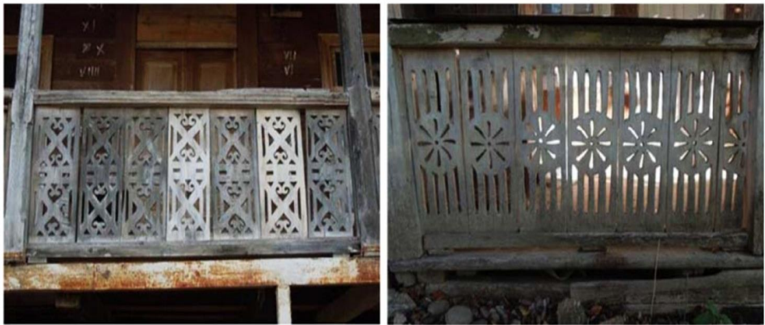
სურ. 3.4.2 ხის ჭვირულაივნისანი სახლები

ხის სახლს ტურისტთა განთავსების საშუალებად გამოყენების კონტექსტში, ჩვენი თვალსაზრისით, გარკვეული უპირატესობა გააჩნია ქვითკირის სახლთან შედარებით: