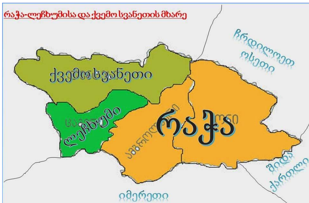
რუკა 2.1.1 რაჭა-ლეჩუმის და ქვემო სვანეთის მხარე

თანამედროვე რაჭა მოიცავს ამბროლაურისა და ონის მუნიციპალიტეტებს.