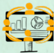
მომხმარებელთა გამოცდილების და ლოიალურობის პროგრამების მართვა