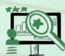
ტალანტების მოზიდვა და განვითარება