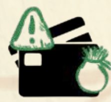
ფინანსური რისკების და საზღვარის მართვა