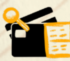
ფინანსური აუდიტი და შიდა კონტროლი