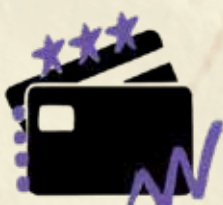
პრემიუმ ბანკინგი და საბროკერო საქმე