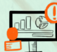
საოპერაციო რისკები და აუდიტი