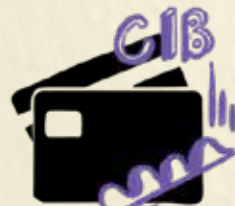
კორპორაციული და საინვესტიციო ბანკინგი