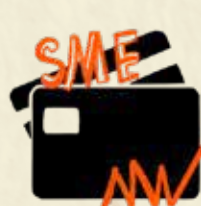
მცირე და საშუალო ბიზნესის ბანკინგი